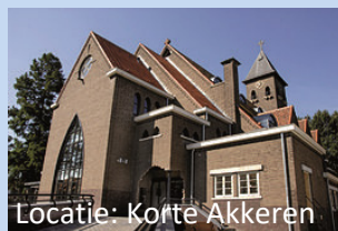
Locatie: Korte Akkeren

Wilt u meer informatie, heeft u een vraag of wilt u zichzelf of uw kind aanmelden bij Logopedie Gouda? Neem dan contact met ons op. Mocht uw telefonische oproep niet direct beantwoord worden, dan kunt u een boodschap op de voicemail achterlaten. Als u uw naam en telefoonnummer inspreekt, nemen wij zo spoedig mogelijk contact met u op. U kunt ook een e-mail sturen naar onderstaand e-mailadres.